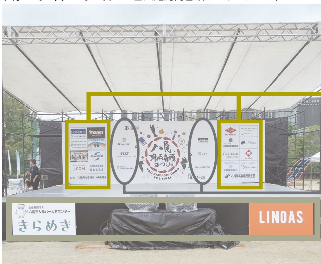
ステージイメージ（第48回八尾河内音頭まつりステージ）